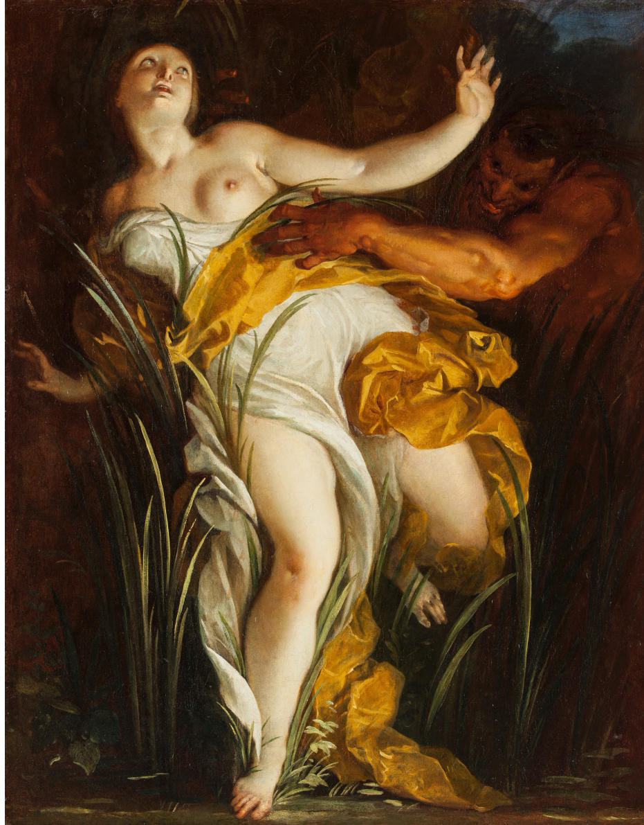
Louis Dorigny (1654-1742) Pan et Syrinx Huile sur toile, 146,7 x 113,5 cm